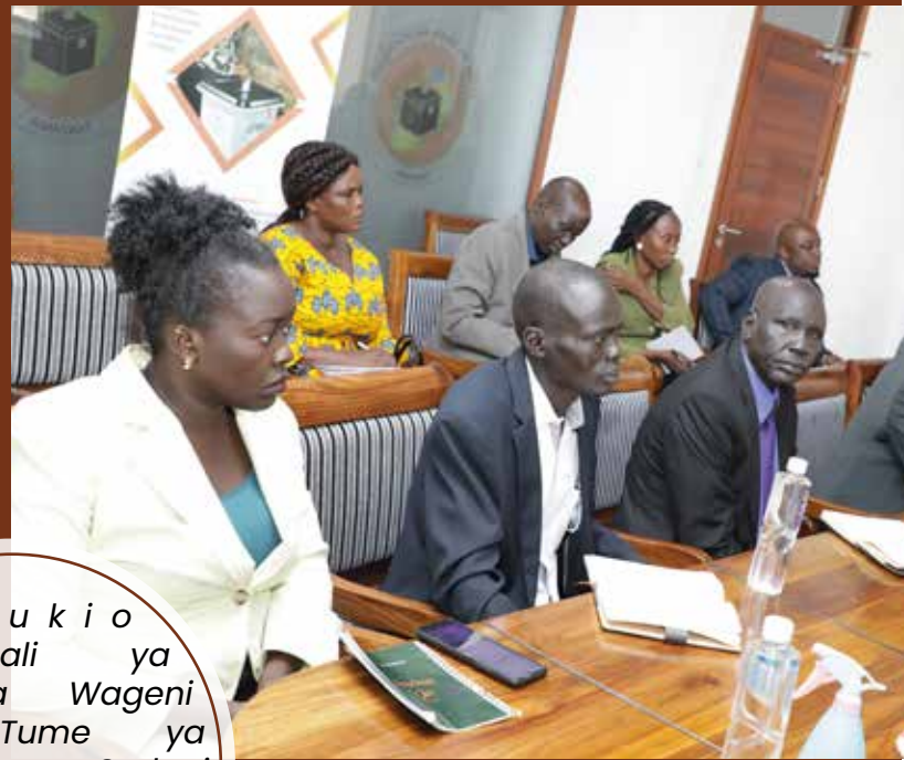
M a t u k i o mbalimbali ya ziara ya Wageni kutoka Tume ya Uchaguzi ya Sudani Kusini walipotembelea Ofisi za Tume, Njedengwa jijini Dodoma.